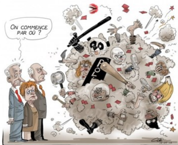
COMMISSION SPÉCIALE SUR LE PRINTEMPS ÉRABLE

N'est-ce pas dans le rêve cependant que naissent la plupart des projets qui en valent la peine ? (René Lévesque)